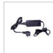
Адаптер питания (DC 24В / 2.8А) Кабель питания 1.2 м